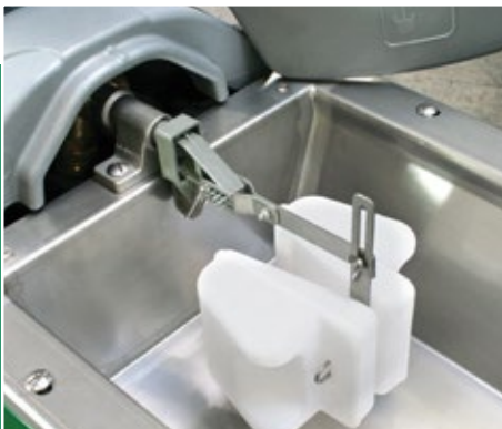
72 l/Min. bei 3 bar