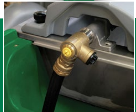
Anschlussstück mit 2 Eingängen